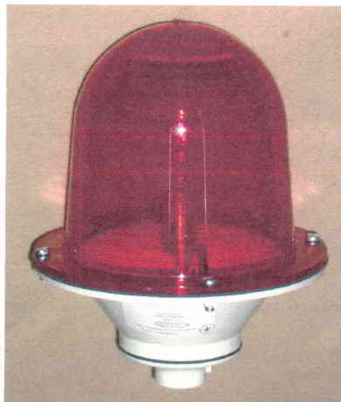
Фото 1 – Внешний вид образца

4.3 Внешний вид образца представлен на фото 1, 2